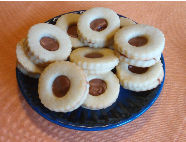
Spitzbuaba mit Nugat

Zu guter Letzt zum Aufbewahren alles in eine Dose legen. Die Spitzbuaba werden nach einem Tag deutlich weicher, da sie etwas Feuchtigkeit der Marmelade aufnehmen.