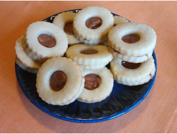
Spitzbuaba mit Nugat